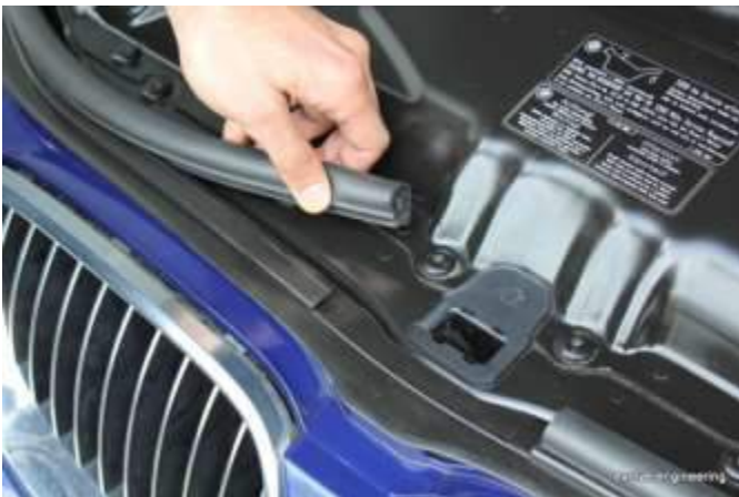
5.1 Gummistreifen entfernen