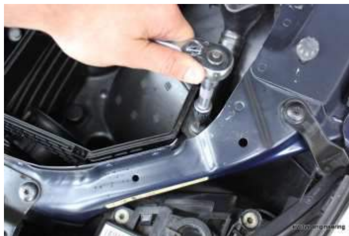
Torx Schraube an Bank 2