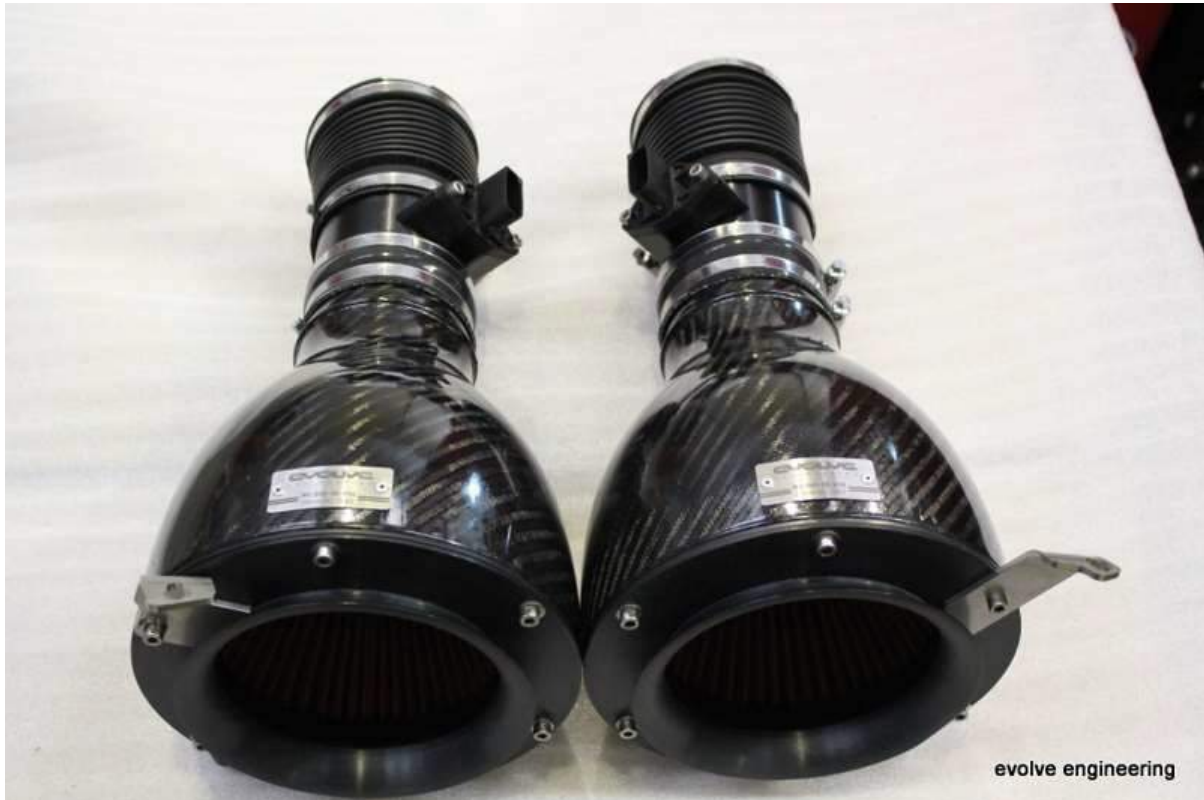
Bank 1 Intake