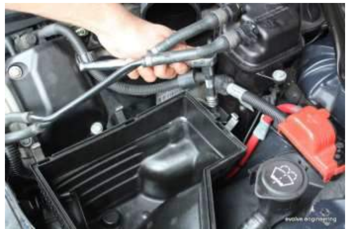
Rear 10mm Schraube an beiden Bänken