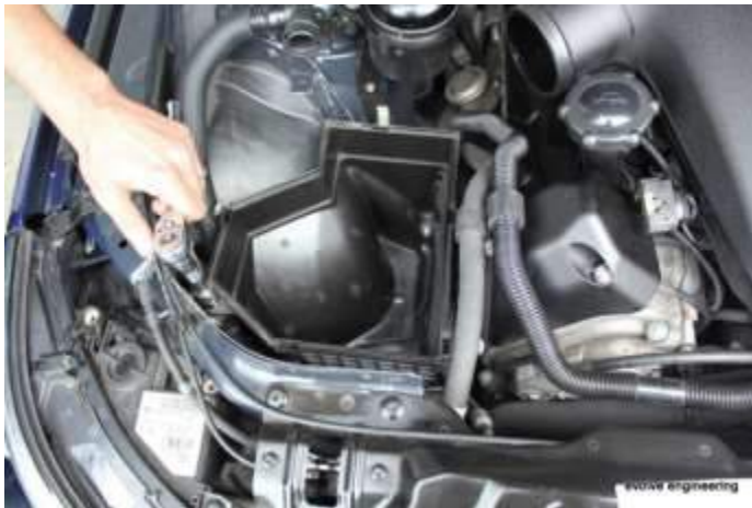
Bank 1 10mm Schraube