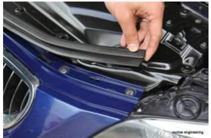
5.2 Plastikstreifen lösen